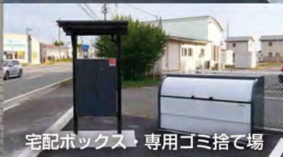
宅配ボックス・専用ゴミ捨て場