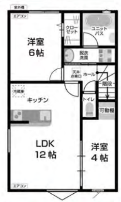
A/B 2F 2LDK 専有面積 54.35㎡