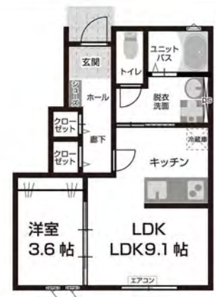
C 1F 1LDK 専有面積 34.17㎡