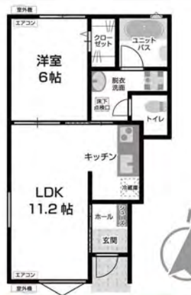
A/B 1F 1LDK 専有面積 42.53㎡