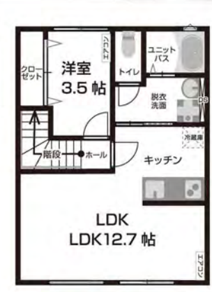
C 2F 1LDK 専有面積 44.08㎡