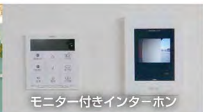
モニター付きインターホン