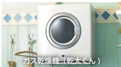
ガス乾燥機（乾太くん）